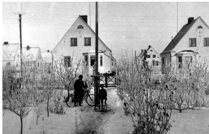
Rosenbergs trädgård, Sävstaholmsgatan 5, i vinterskrud. 1920-talet.