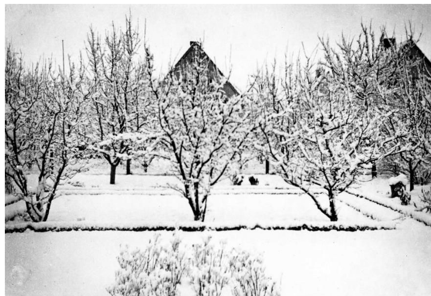
Sävstaholmsgatan 18, trädgården i vinterskrud. 1940-talet.